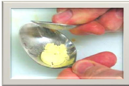
شکل ۲. مقدار قرص تجویز شده در قاشق خرد و در آب حل شده و به نوزاد خورنده شود

روش دوم: مانند روش اول قرص را نصف کنید و تکه‌های قرص را داخل قاشق بریزید و با ته قاشق دیگری روی محتویات قاشق اول فشار بیاورید تا کاملاً خرد شود. سپس چند قطره آب اضافه کنید و قرص را کاملاً حل کنید. سپس این محلول را به کودک بخورانید. مجدداً داخل قاشق را چند قطره آب بریزید و به نوزاد بدهید.